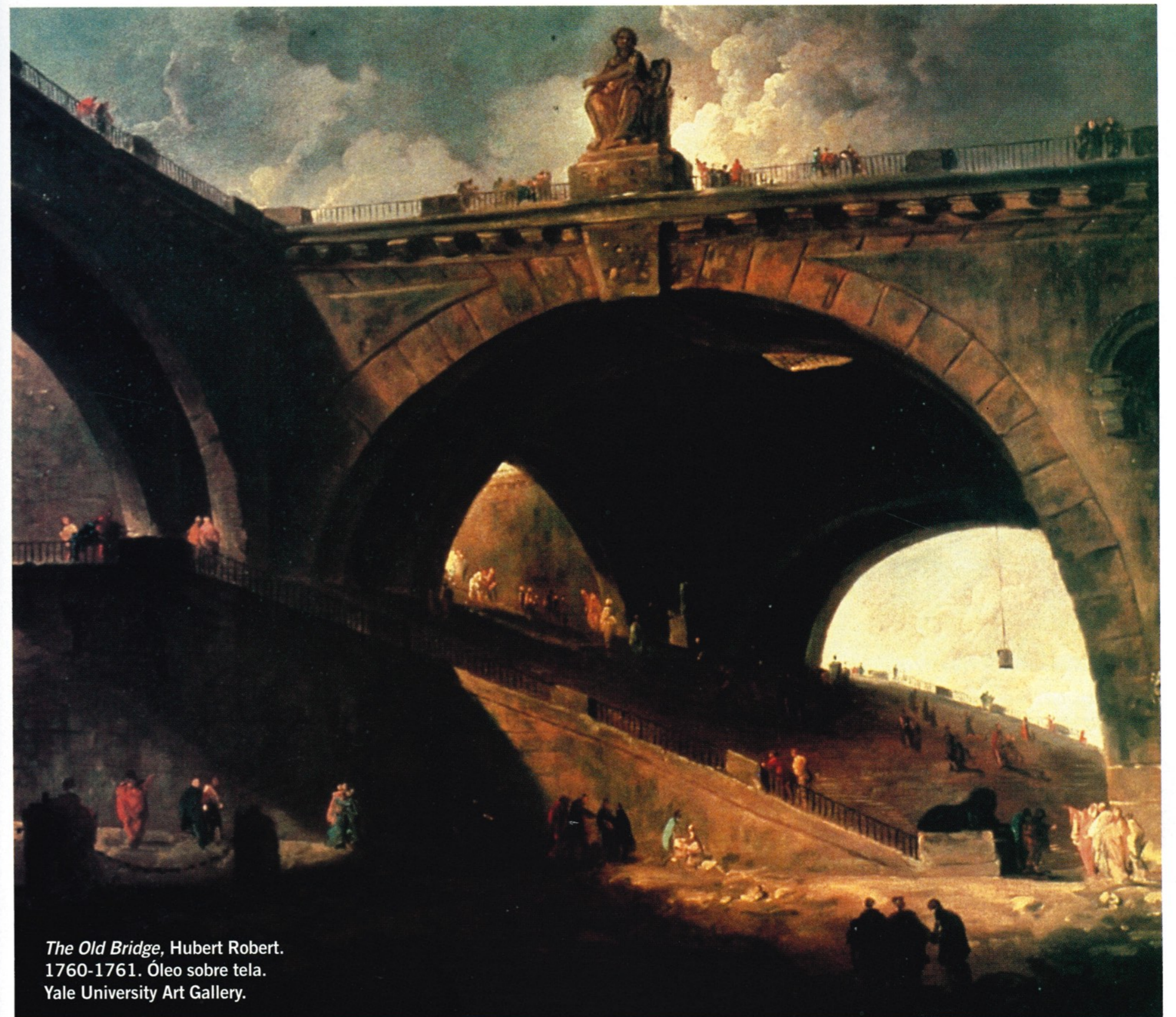
The Old Bridge, Hubert Robert. 1760-1761. Óleo sobre tela. Yale University Art Gallery.

sotros en este reportaje, entre nostálgico, reivindicativo y esperanzado.