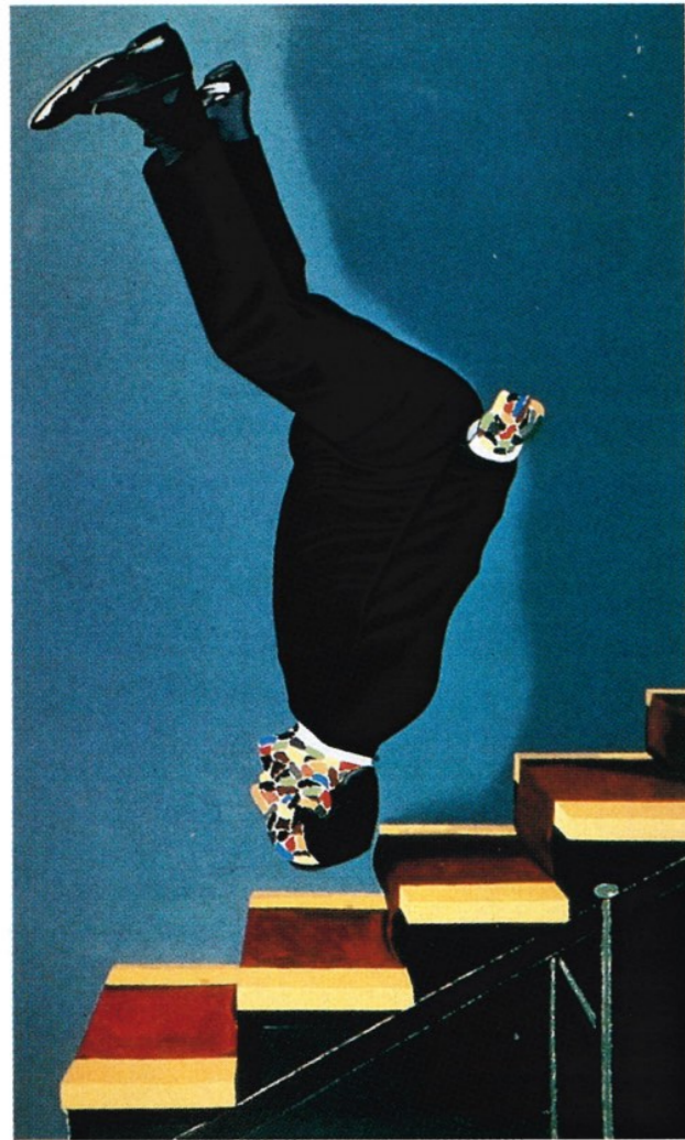
Vestido bajando la escalera, Eduardo Arroyo, 1976. Óleo sobre tela. IVAM.

mitivos, evidentemente anteriores a las escaleras. Primero existieron las pendientes y luego los peldaños para salvarlas, tal vez por ello las rampas, en general, me parecen elementos groseros. Estoy juzgando el elemento arquitectónico, no la necesidad de un elemento con cierta pendiente y longitud para que los minusválidos puedan tener acceso a los edificios. Eso es otro asunto. La rampa, en general, me parece un elemento primitivo. El Macba de Richard Meier, el Museo de Arte Contemporáneo de Barcelona, parece un edificio construido nada más que para bajar y subir rampas. Eso me parece una tontería.