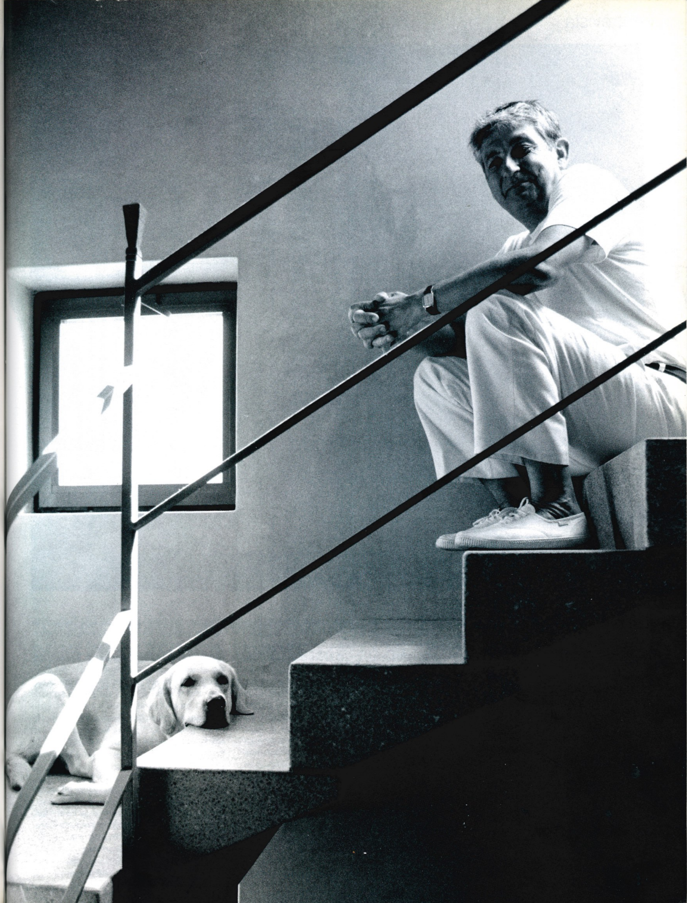
El arquitecto Óscar Tusquets con su perro.